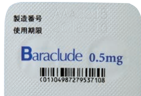
GS1コード表示位置：シート上部