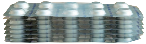
10錠×7シート(7シート段積/バンディング)/箱