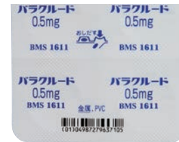
GS1コード表示位置：シート下部